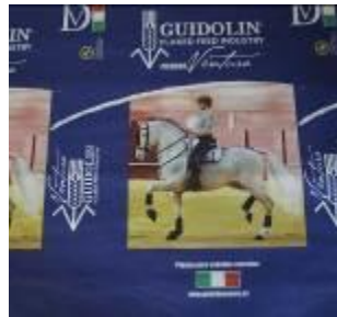
GUIDOLIN Impresión en Tricromía, Cuatricromía o más Impresor: INDUSAC Reproductor: GRABALFA