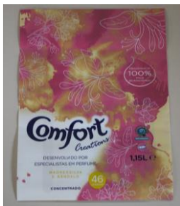
SLEEVE COMFORT Impresión en Tricromía, Cuatricromía o más Impresor: OVELAR Reproductor: OVELAR