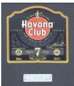
HAVANA CLUB RON AÑEJO 7 AÑOS Impresión en Línea (Pluma) Impresor: GRÁFICAS VARIAS, S.A. Reproductor: GRÁFICAS VARIAS, S.A.