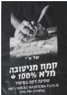
HARINA DE TRIGO HAGDOLOT Impresión Tramada Impresor: INDUSTRIAS BOLCAR Reproductor: GRABALFA