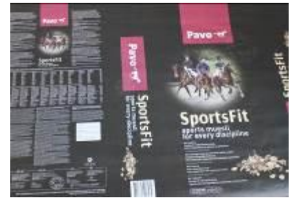
PAVO Impresión en Tricromía, Cuatricromía o más Impresor: INDUSAC Reproductor: DIFLEX